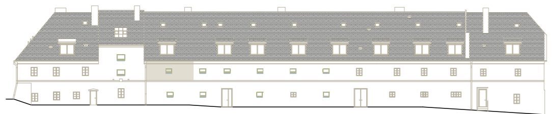
budova A (jižní křídlo) – pohled z ulice