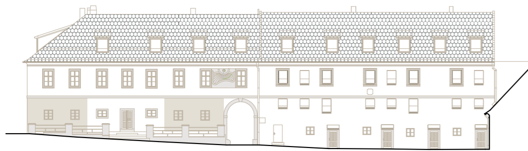
budova C/D (severní křídlo) – pohled z vnitrobloku