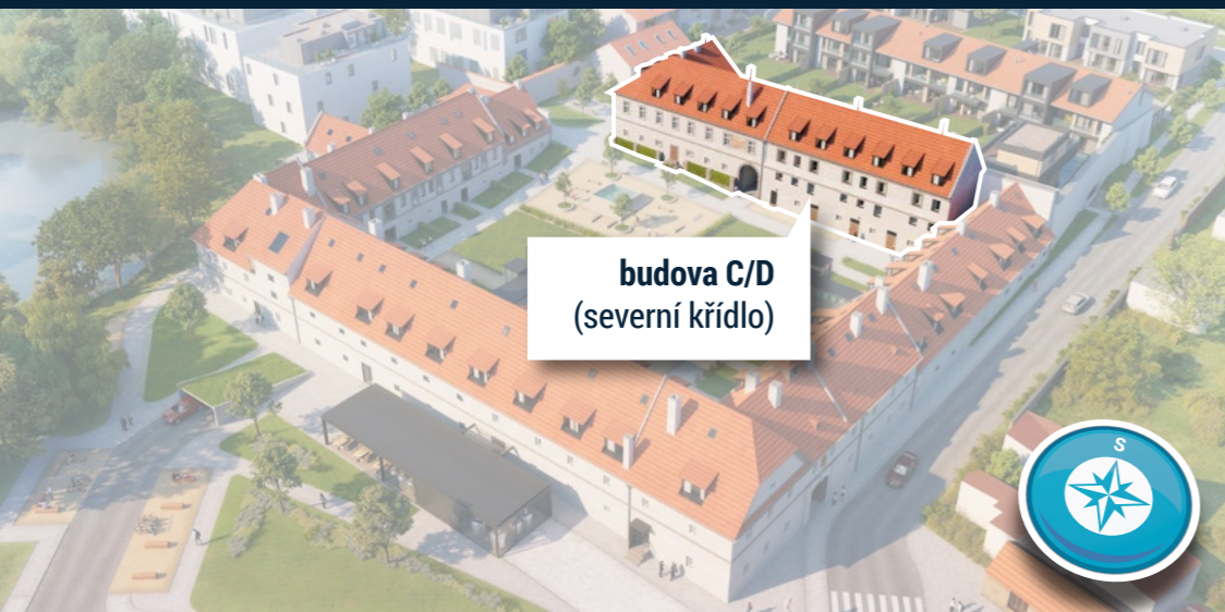
budova C/D (severní křídlo)